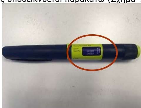
Σχήμα 1. Tresiba® FlexTouch®